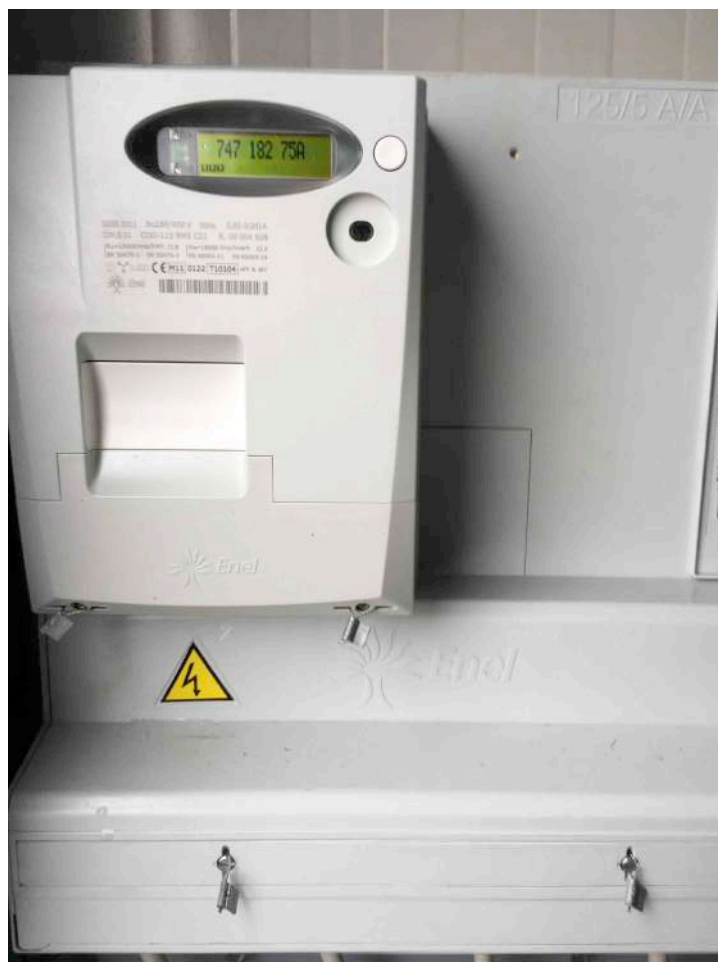
Foto n. 10 (contatore di produzione Enel con TA sigillati da Enel)